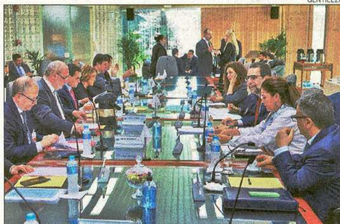
Reunión. Los integrantes del Consejo de Administración de la Itaipú tuvieron sesión ayer.

márgenes participaron de la sesión donde, entre otros temas abordados, se inició el análisis de las bases presupuestarias del ejercicio 2024 de la Binacional", anunció escuetamente la entidad en su cuenta de la red social X (ex Twitter).