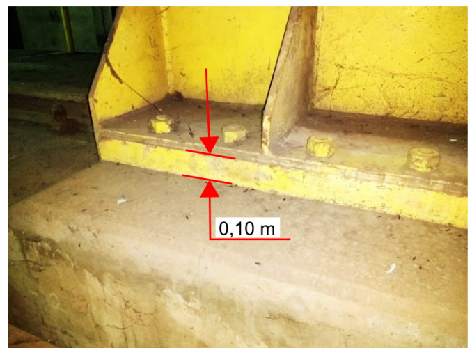
Figura 3. Detalle de fijación de la Base del fin de curso

Peso Fin de Curso: 1000 kg (aproximadamente)