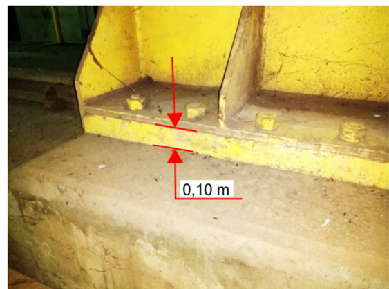
Figura 3. Detalle de fijación de la Base del tope

Peso del tope: 1000 kg (aproximadamente)