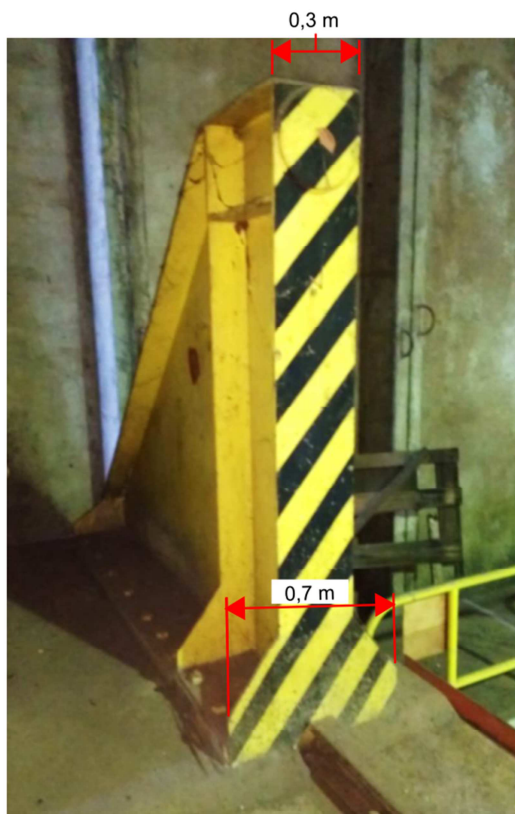
Figura 2. Vista frontal del tope